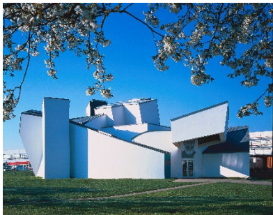
Vitra Design Museum, Frank Gehry, 1989, © Vitra Design Museum, photo: Thomas Dix

ヴィトラ デザイン ミュージアムは、世界有数のデザイン・ミュージアムのひとつに数えられています。当館は、過去から現在に至るデザインの研究と紹介に重点を置き、デザインと建築、美術、そして日常文化との関係性を探求しています。フランク・ゲーリー設計による本館では、毎年 2 本の主要な企画展が開催されています。当館の活動はコレクションを基盤としています。コレクションには、デザイン史における重要な作品群に加え、著名デザイナーやデザイン界の重要人物のアーカイブも含まれています。展覧会は巡回を前提として構想されており、世界各地の会場で紹介されています。