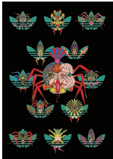
⑭ 《夢の王国》2018 顔料インク、アクリル・シルクスクリーン、 ガラスの粉末、ラメ、アクリル絵具/ カンヴァス 140 x 100 x 4 cm ⑮ (RADWIMPS ワールドツアー 2024 のための アートワーク) 2024 ⑯ 《ドカーン》2022 顔料インク、アクリル・シルクスクリーン、 ガラスの粉末、ラメ、アクリル絵具/ カンヴァス 149 x 100 cm

田名網は、その長いキャリアを通して多種多様なクライアントワークやコラボレーションを行ってきました。Mary Quant、adidas(14)、JUNYA WATANABE、Ground Yなどのファッションブランドや、GENERATIONS from EXILE TRIBE、八代亜紀、RADWIMPS(15)といったミュージシャンと協働する一方で、ウルトラマンなどのキャラクターや生前交流があった赤塚不二夫(16)とコラボレーションした作品も制作しています。本展では田名網のデザイナーとしての活動にも焦点を当て、当初からコラボレーションの意識を強く持ち、それによって生じる化学反応から新たな作品を作り出していこうとする田名網の仕事についても紹介します。