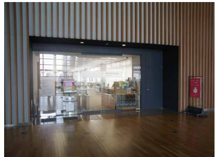
アートライブラリー正面入口

この他ご質問等ございましたら、カウンターまでお気軽にお問い合わせください。アートライブラリーでは今後も皆様のご利用をお待ちしています。