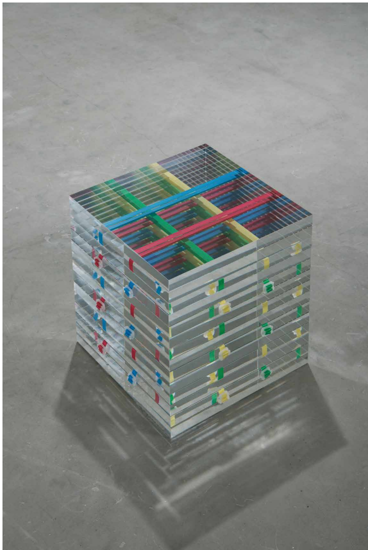
富井大裕 (board band board #2) 2014年 PPバンド、アクリル板