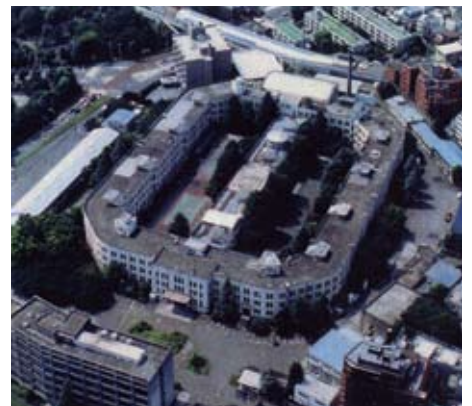
北側からの航空写真(2001年撮影) 建物の全体像が分かります