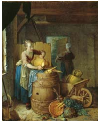
Fig.4 ウィレム・ヨーセフ・ラキエ《納屋でバケツを磨く女》、1778年、 油彩、カンヴァス、53.5×44cm、所蔵先不明

ファン・ストレイ1世は、17世紀の画家ピーテル・デ・ホーホやハブリエル・メツの作品を模範にしながら、画面の隅々にまで均質に満ちた、より暖かく明るい光のなかに、市民のさりげない日常を描き出した。《大鍋の内側を磨く女》はその典型である。室内の白壁は暖かい光をより際立たせ、鍋の内側は黄金色に磨き上げられており、質素な台所で昔