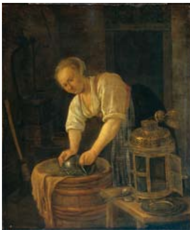
Fig.1 ヤン・ハーフィクスゾーン・ステーン《金物を磨く女》、1658-1660年頃、油彩、板、24.5×20cm、アムステルダム国立美術館

縫い物をする女、りんごの皮をむく女、掃き掃除をする女——オランダ風俗画には、部屋の一隅で日々の務めに専念する女たちが繰り返し登場する。女たちの視線もしぐさも自然でさりげなく、まるで日常生活のひとつまを垣間見たかのような印象を受ける。本展覧会に出品された同じ題材の風俗画、ヤン・ハーフィクスゾーン・ステーンの《金物を磨く女》(Fig.1)とアブラハム・ファン・ストレイ1世の《大鍋の内側を磨く女》(Fig.2)もその好例であろう。明暗の効果や筆遣い、配色