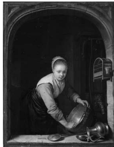
Fig.3 ヘラルト・ダウ《鍋を磨く女》、油彩、カンヴァス、17.1×13.3cm、イギリス王国コレクション、ロンドン

まず、17世紀の作品から見ていこう。「金物を磨く女」は、17世紀オランダ風俗画では