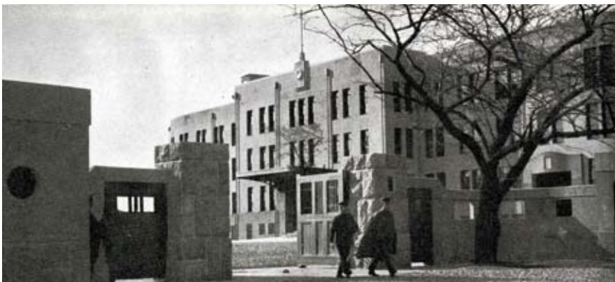
兵舎時代の正面写真